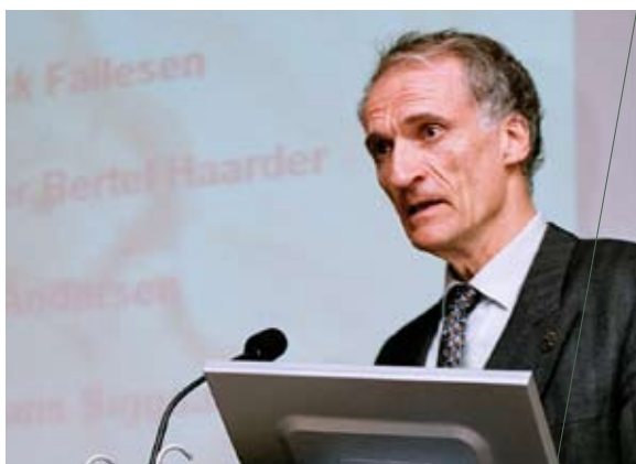
Undervisningsminister Bertel Haarder

Reformarbejdet er godt i gang inden for alle uddannelsessektorer. På undervisningsministeriets område vil vi samle de mellemlange videregående uddannelser i regionalt baserede professionshøjskoler. Formålet med fusionerne er at styrke uddannelsernes faglighed og at skabe udviklende og udfordrende studiemiljøer. Det skal samtidig være miljøer, som gør uddannelsesinstitutionerne attraktive for internationale samarbejdspartnere. Det internationale uddannelsessamarbejde giver mulighed for at benchmarke vore uddannelser efter en international målstok. Samarbejdet giver samtidig mulighed for at udveksle studenter og lærere og indgå i langsigtede forpligtende samarbejder.