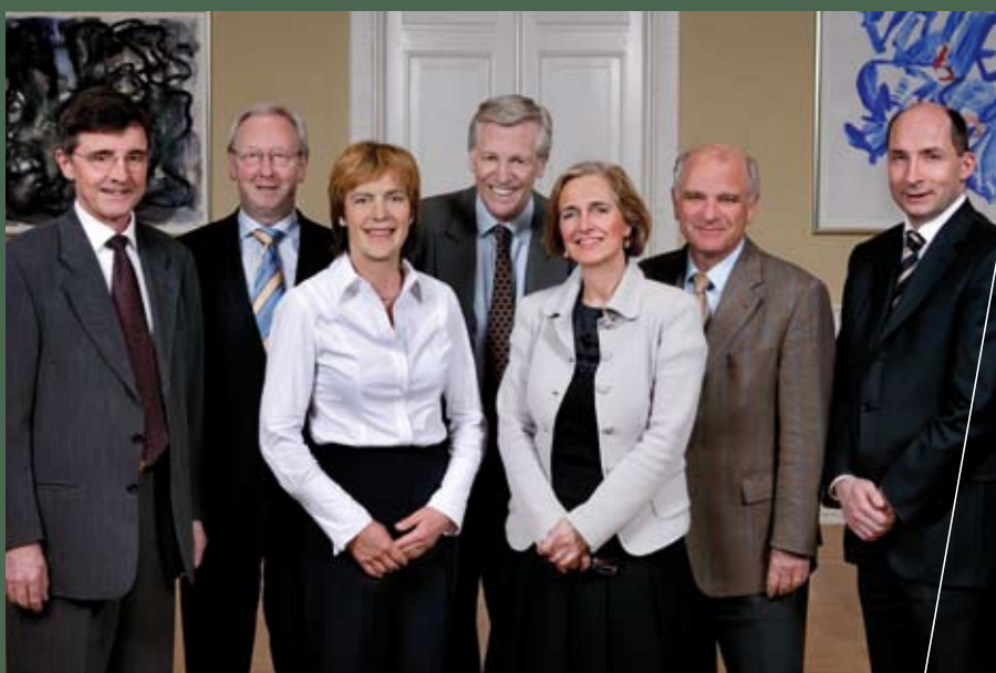
FUHUs bestyrelse. Se oversigt over medlemmerne side 13