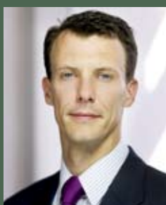
FUHUs protektor Hans Kongelige Højhed Prins Joachim