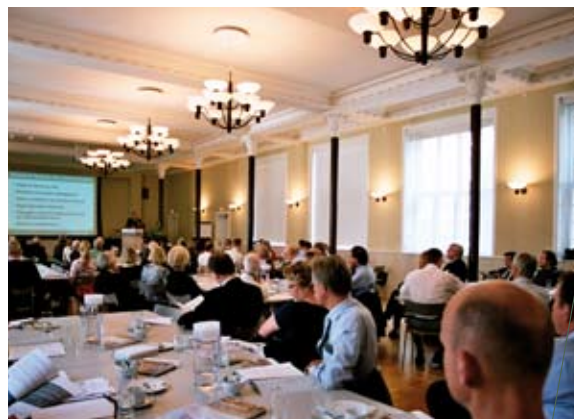
Årsmødet 2006 i FUHU Konferencecenter